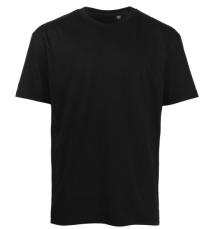
002 - Black