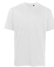
001 - White